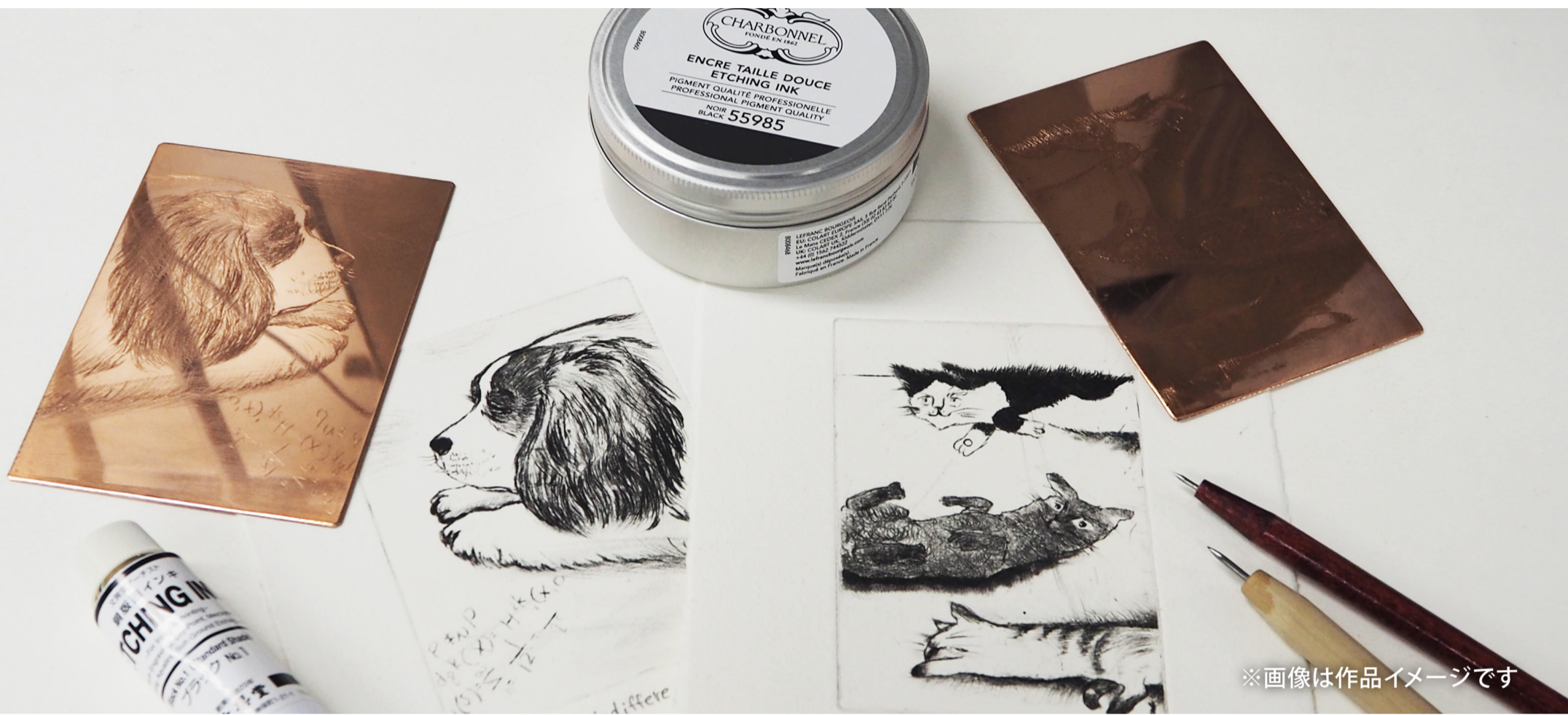
※画像は作品イメージです

銅版を削って絵を描き、プレス機を使いはがきサイズの作品を仕上げます。講師が道具の使い方もレクチャー致しますので、全く経験のない方でも安心してご参加ください。