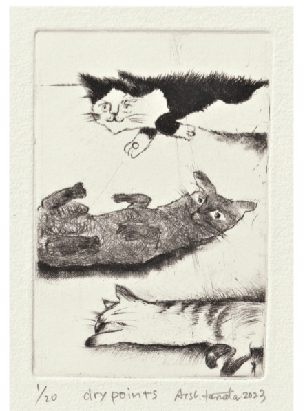
1/20 drypoints Atsuko Kanata 2023